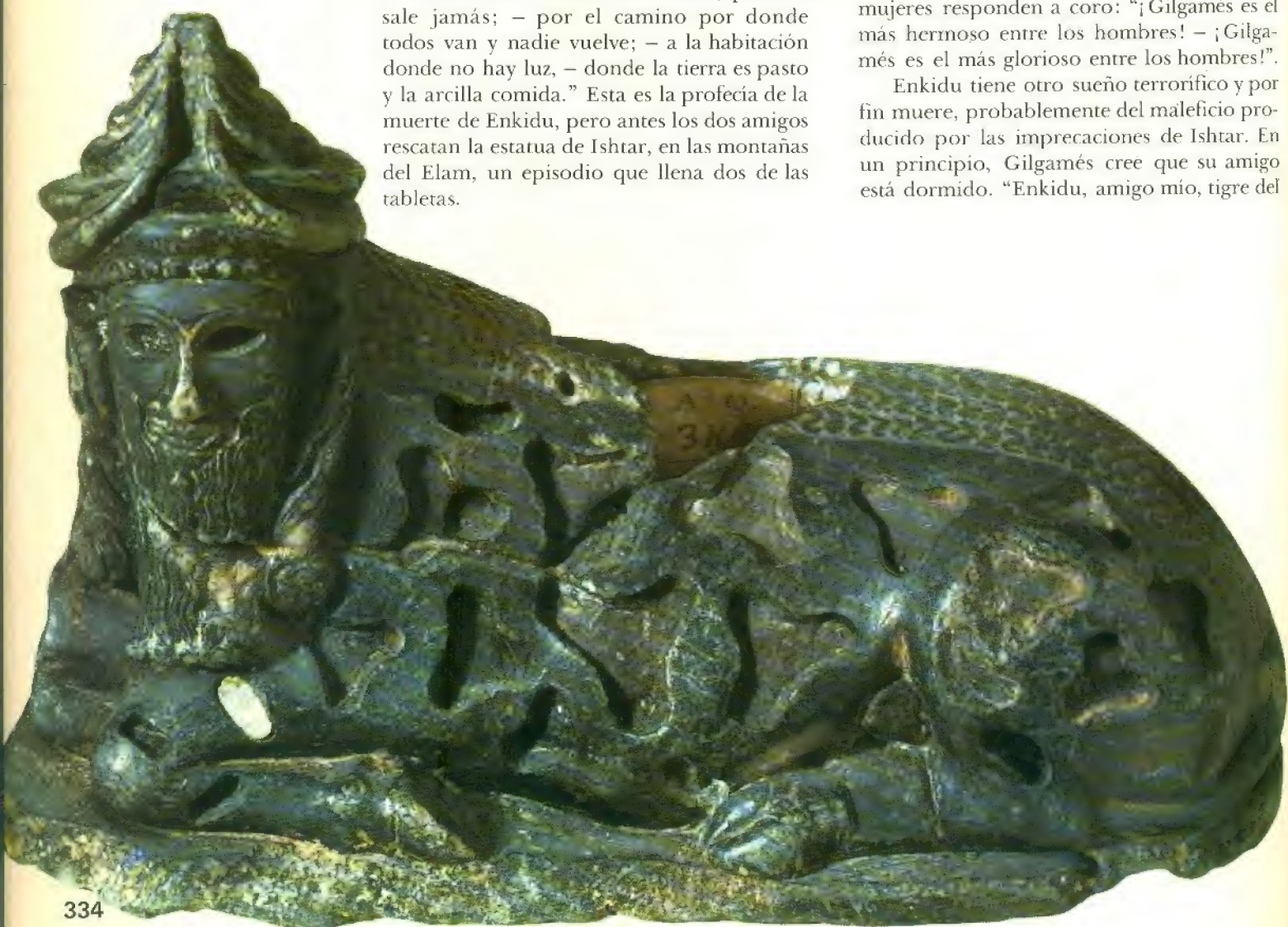
Toro androcéfalo de esteatita con huecos para incrustaciones, procedente de Sírputa, de mediados del III milenio (Museo del Louvre).

Enkidu tiene otro sueño terrorífico y por fin muere, probablemente del maleficio producido por las imprecaciones de Ishtar. En un principio, Gilgamés cree que su amigo está dormido. “Enkidu, amigo mío, tigre del